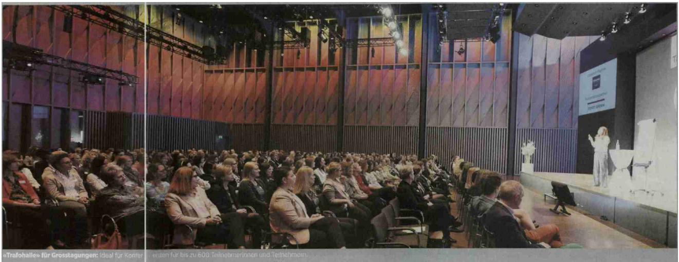
«Trafohallen» für Grosstagungen: Ideal für Konferenzen für bis zu 600 Teilnehmerinnen und Teilnehmern

www.baden.ch www.baden.ch/tagungen www.cityticket.baden.ch www.sterk.ch www.trafobaden.ch