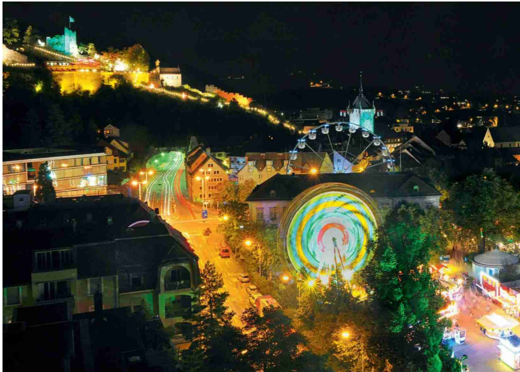
Baden in Feststimmung

Abo-Nr.: 1078634 Seite: 56 Fläche: 100'965 mm 2 AEV (in Tsd. CHF): 5.9