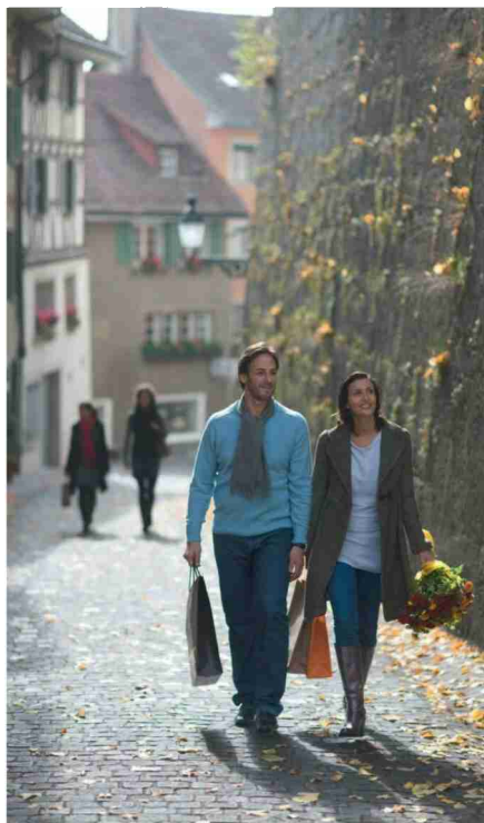
Shopping in Baden, © Stadt Baden

Passt Erholung und Einkaufen zusammen? In Baden schon. Verschiedenste Ladenpassagen mit abwechslungsreichem Flair in einer grosszügigen Flanierzone verlocken zum Eintauchen ins moderne Shoppingvergnügen oder ganz persönlichen Einkauf in gepflegten und speziellen Kleinstläden.