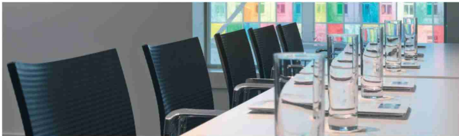
Kongress- und Businesszentrum Trafo Baden, © Stadt Baden

Badener «Lichterwecke»: 29. November 2017